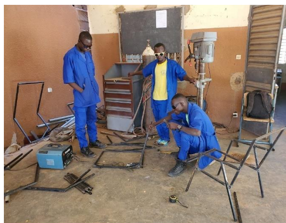
Apprenants en soudure