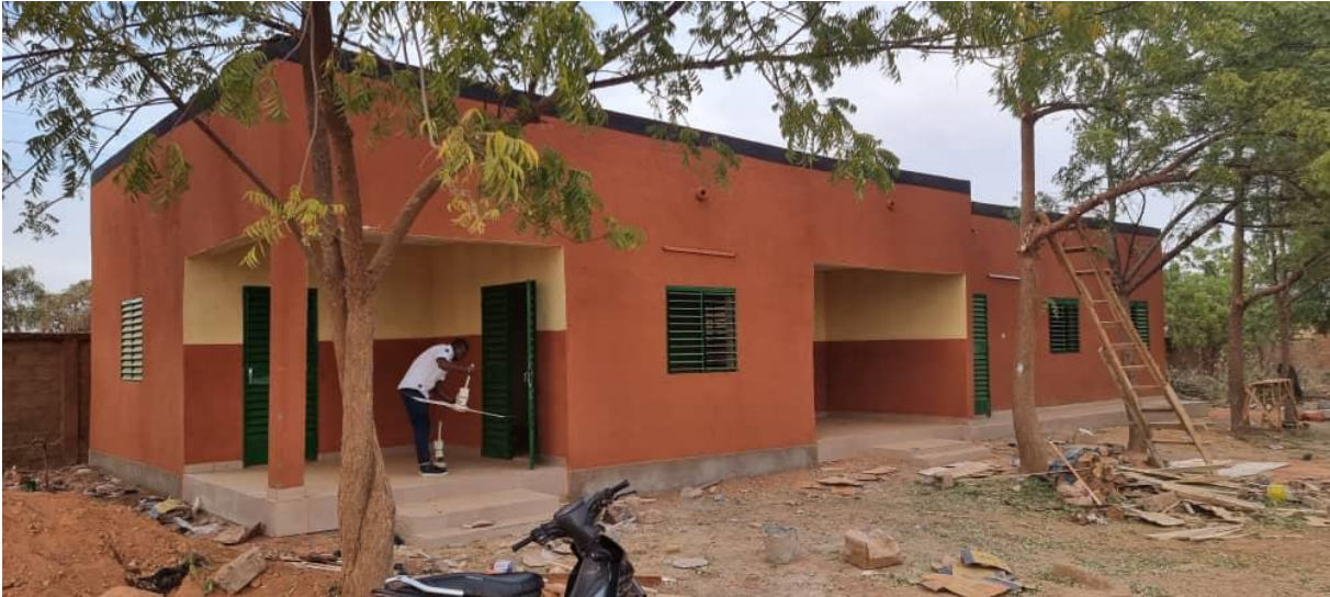
La réalisation du local de l'incubateur.

Le projet initial dure trois ans et pour cette année 2021, les activités mises en œuvre sont :