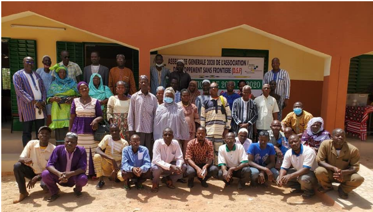
L'assemblée générale de l'association DSF