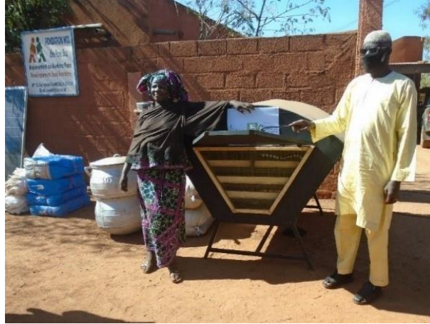
Remise de matériel