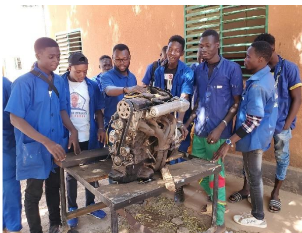
Apprenants en auto-électricité

La section mécanique cyclomoteur n'a pas eu assez de nouveaux apprenants pour cette année scolaire 2021-2022, ce qui a motivé sa fermeture.