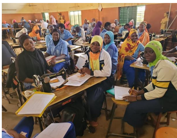
Apprenants coupe couture