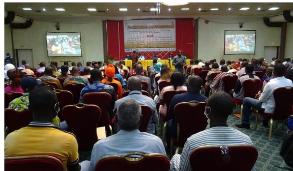
Participation du coordonnateur de DSF et la présidente de la Fondation WOL à la conférence du SPONG et DGCOOP.