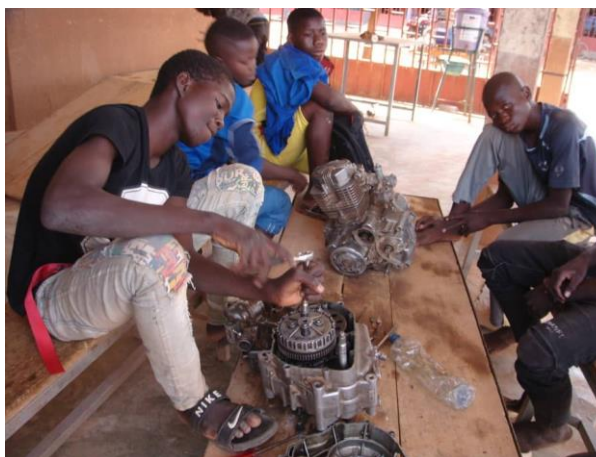
Apprenants en mécanique