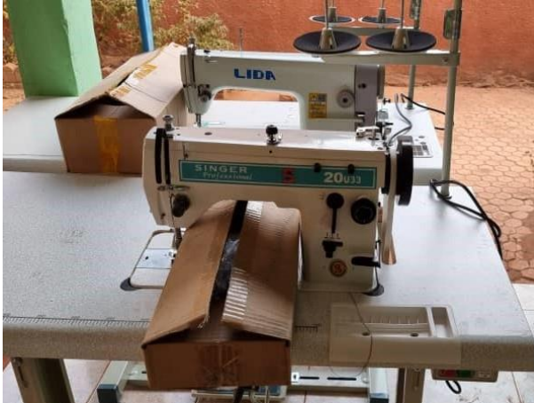
Machines de broderie.