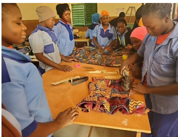
Apprenants coupe couture