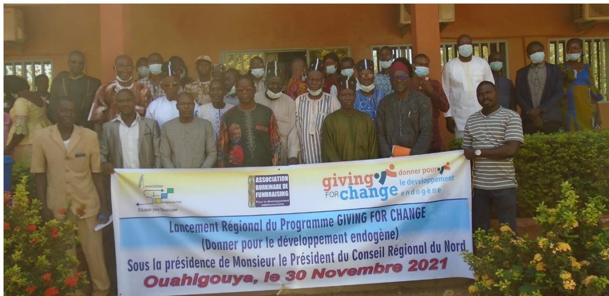
Lancement des activités du programme Giving for change/ Nord

Le Lancement du programme Giving for change (Donner pour le développement endogène) a été fait au niveau régional avec l'implication de tous les membres de la COP, la participation des autorités administratives, politiques, coutumières, religieuses, des services techniques de la région du nord et du DG de ABF et coordonnateur national du projet Giving for change.