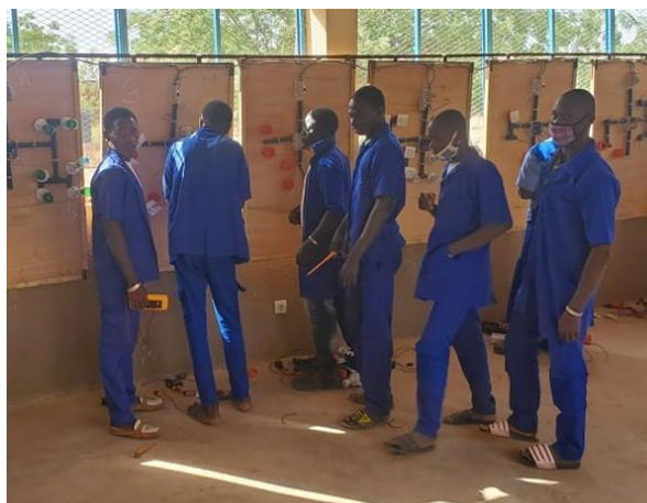
Apprenants en électricité bâtiment