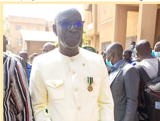
Une reconnaissance officielle en honorant l'association DSF par une décoration nationale de « chevalier de l'ordre du mérite burkinabè pour la formation professionnelle » avec agrafe promoteur de la formation professionnelle au Burkina.