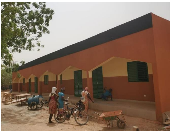
Les deux salles de classes

Avec le financement de la fondation MRC-Hollande à travers la Fondation WOL, il a été réalisé deux (02) salles de classe pour abriter les ateliers de la coupe couture au complexe Zoodo. Le bâtiment a été réalisé dans les normes avec un suivi technique qui garantissant la qualité de l'ouvrage. Ce sont des salles plafonnées au PVC et carrelées pour éviter les termites. Toutes les salles ont été équipées de tables bancs, de meubles de rangement et bureaux pour les moniteurs. Ces deux nouvelles salles accueillent respectivement des effectifs de 74 et 76 apprenants pour cette rentrée scolaire 2021-2022.